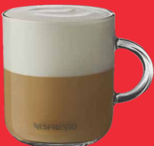
CAPPUCCINO $ 85