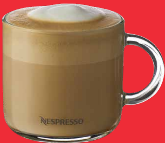
LATTE $ 89