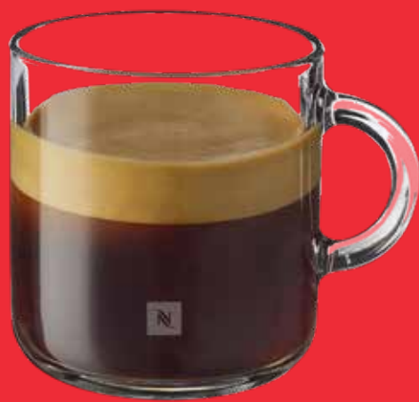
ESPRESSO DOBLE $ 68