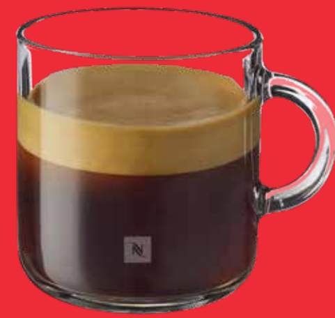
ESPRESSO $ 52