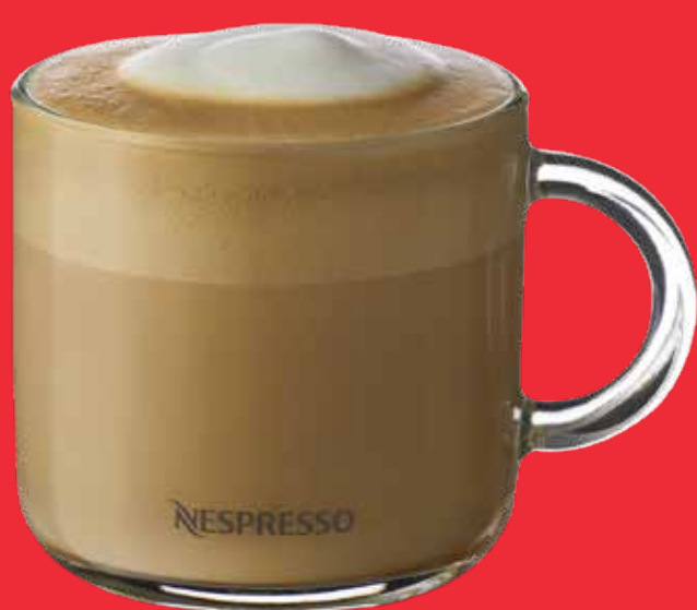
CAPPUCCINO $ 85

TE CHAI LATTE $ 81 SHOT EXTRA CAFÉ $ 30 CAMBIO DE LECHE $ 16