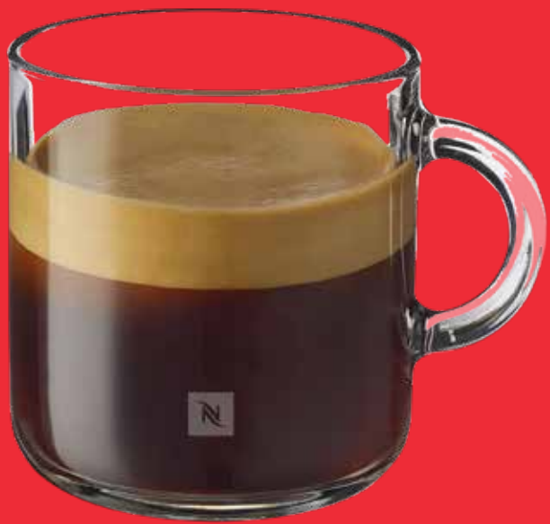
AMERICANO $ 75