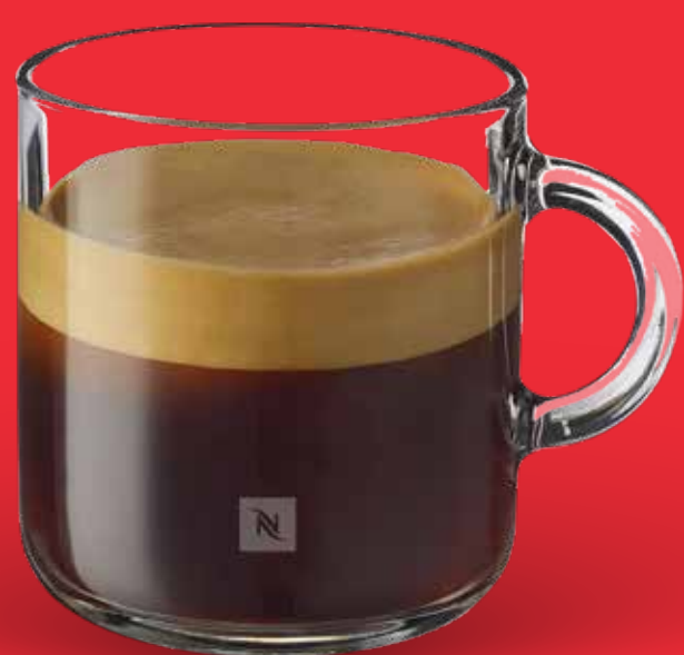
AMERICANO $ 75