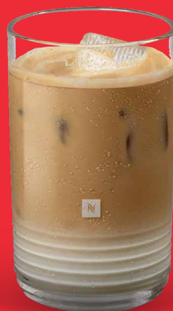
LATTE FRÍO $ 85