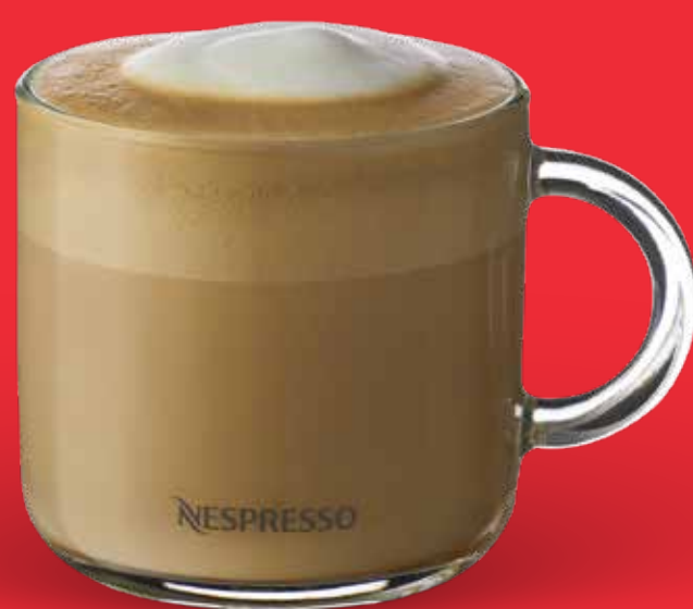
LATTE $ 89