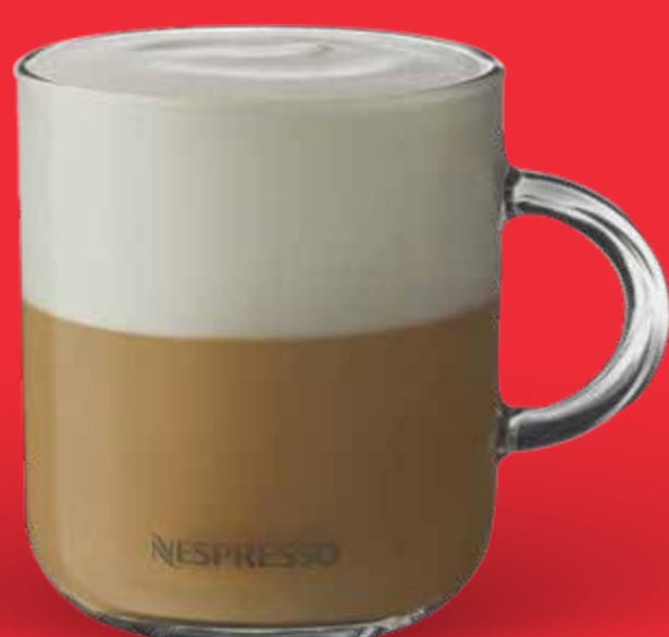
CAPPUCCINO $ 85