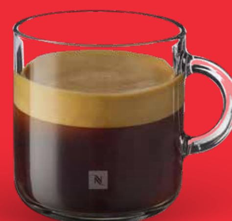
ESPRESSO $ 52 ESPRESSO DOBLE $ 68