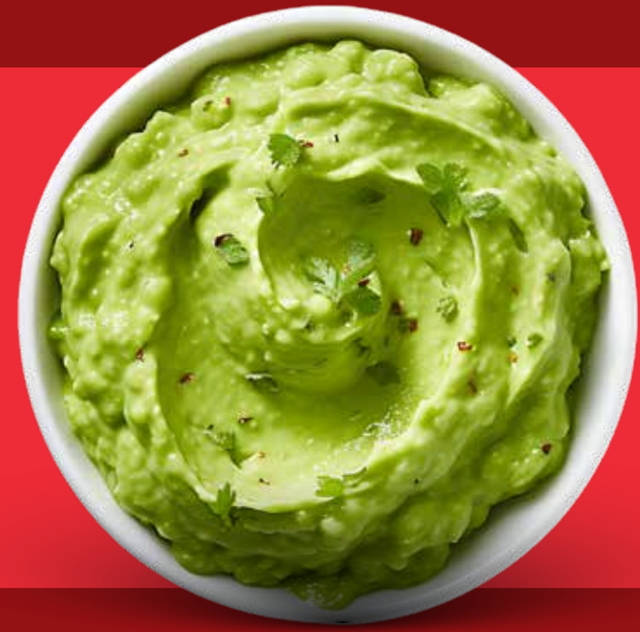
SIDE DE GUACAMOLE $ 60