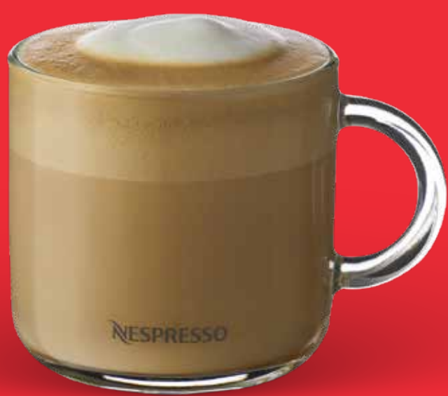
LATTE $ 89