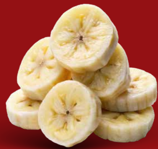
PLÁTANO $ 25