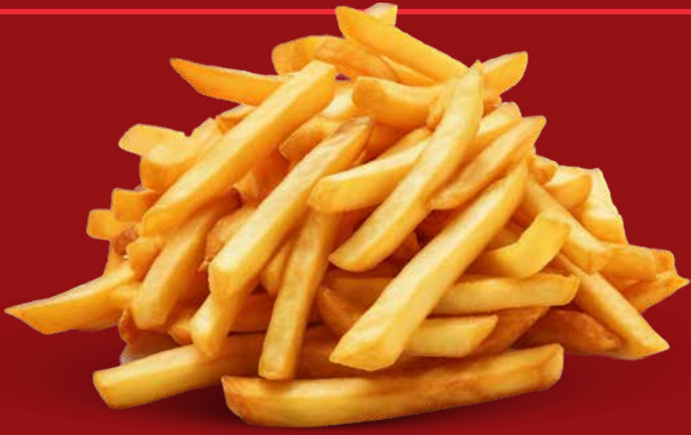
MEDIA ORDEN DE PAPAS $ 60

PRODUCTOS NO DISPONIBLES PARA VENTA INDIVIDUAL