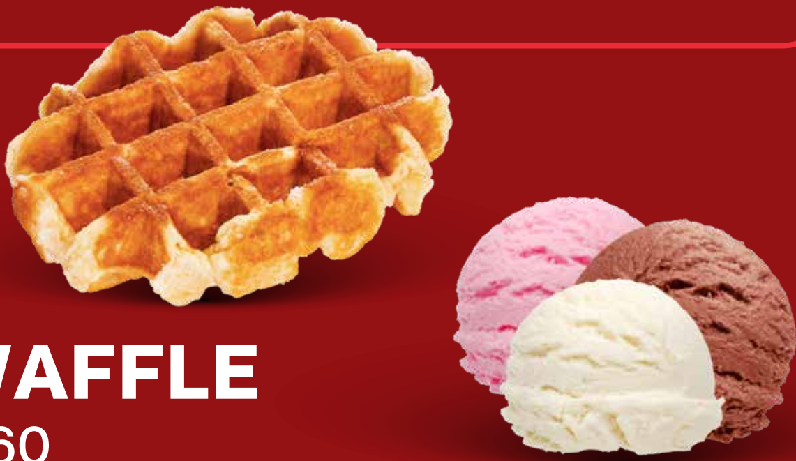
WAFFLE $ 60

Queso Cilantro Piña Habanero Chiles Treados