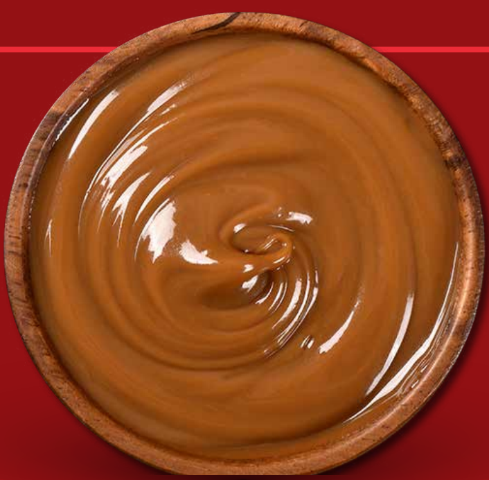
NUTELLA $ 50 CAJETA $ 50 MERMELADA $ 50