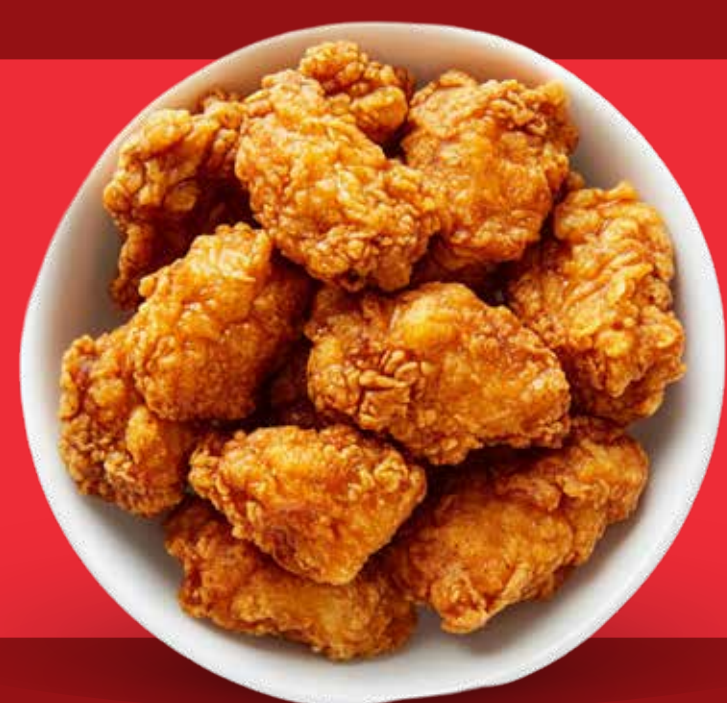
PROTEÍNA EXTRA $ 80 c/u