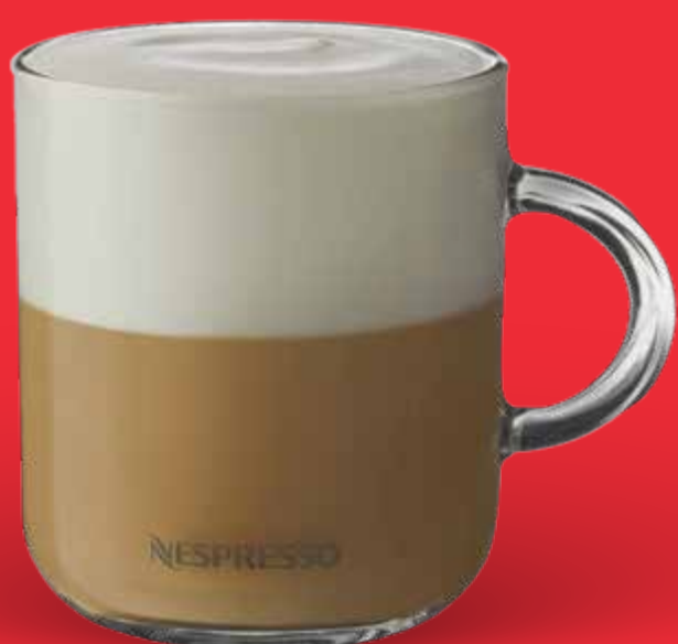
CAPPUCCINO $ 85