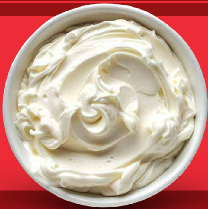
SIDE DE PHILADELPHIA $ 60