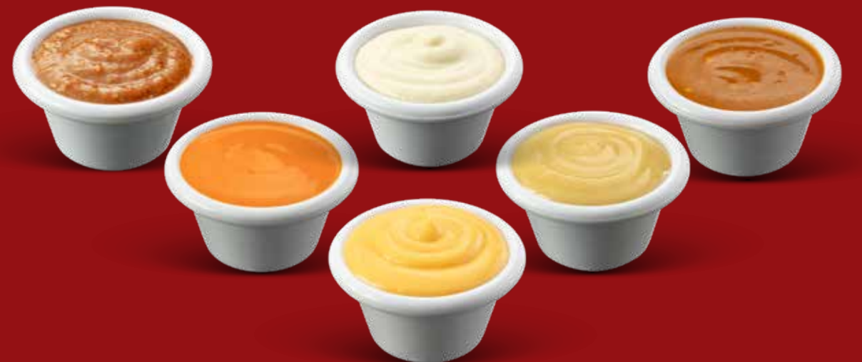
SALSA EXTRA $ 40 c/u

Mango Habanero Tamarindo Buffalo Mostaza Miel