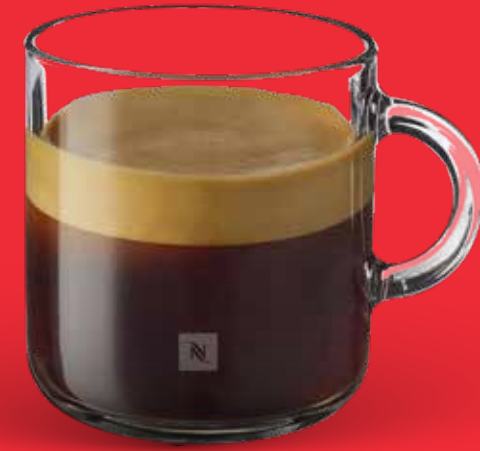
ESPRESSO $ 53 ESPRESSO DOBLE $68