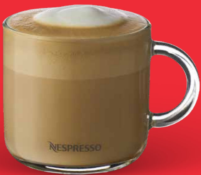
LATTE $ 89