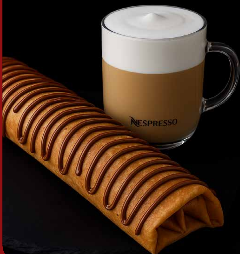
COMBO CREPA CAFÉ CAFÉ LATTE O CAPPUCCINO + CREPA DE NUTELLA $ 180

Incluye 1 café cappuccino o 1 café latte (normal o descafeinado) 235 ml + 1 crepa de Nutella (base para Crepa 118 ml, Nutella 100 g, Plátano 50g). El cambio de leche tiene un costo adicional de $16, aplica solo crepa de Nutella, producto sujeto a disponibilidad, las imágenes utilizadas son ilustrativas, la presentación y el tamaño de los productos puede variar. Todos los precios incluyen IVA y están estimados en pesos mexicanos.