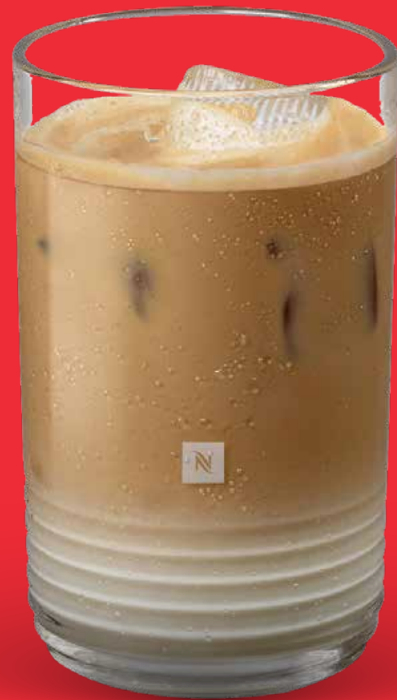
LATTE FRÍO $ 86