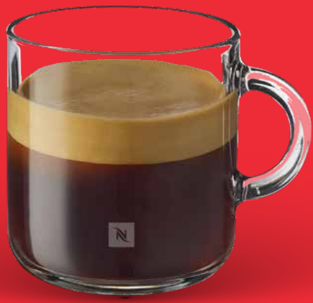
AMERICANO $ 76