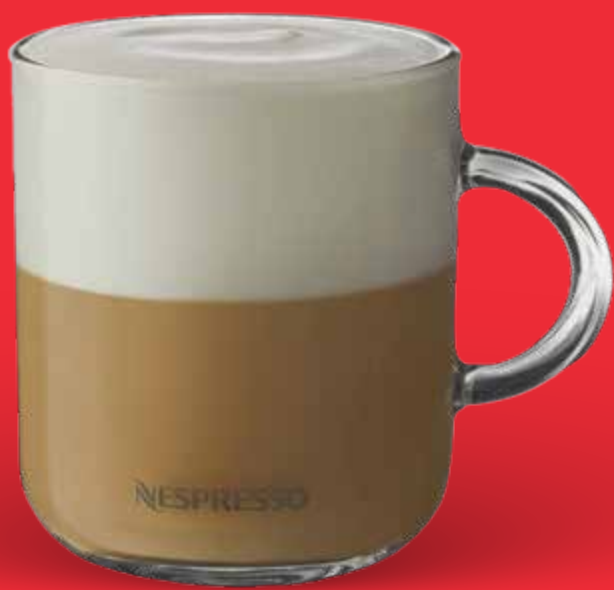
CAPPUCCINO $ 86